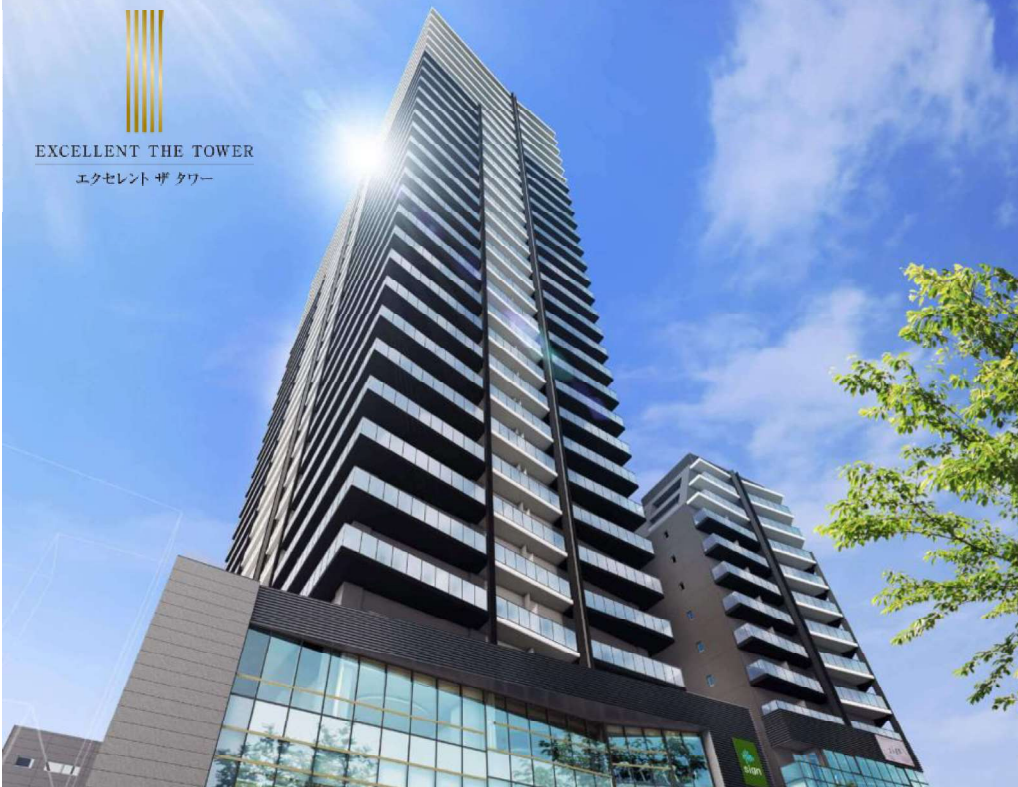
EXCELLENT THE TOWER エクセレント ザ タワー

当物件は「あなぶきホームライフ」が提携いただいている企業にお勤めの皆様への窓口を行います。