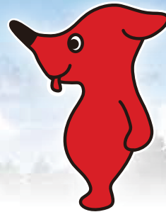
千葉県PRマスコットキャラクターターナーくん